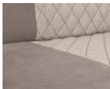
+ Bekleding Jupiter