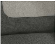
+ Bekleding Calypso