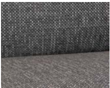
+ Bekleding Floyd