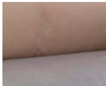
+ Bekleding Duke