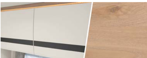
+ Meubeldecor Noce Nagano