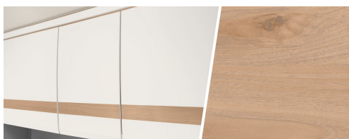
+ Meubeldecor Noce Nagano