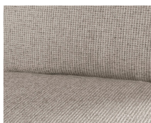
+ Bekleding Heron